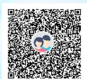
2023 级新生 QQ 群