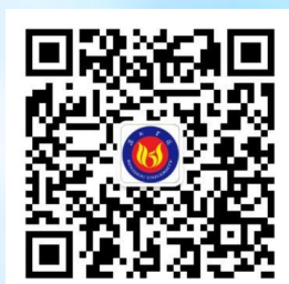
滨州学院官方微信