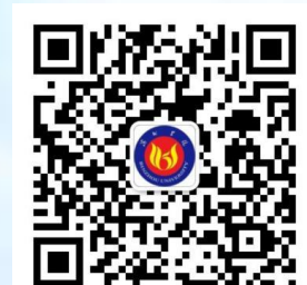
滨州学院研究生官方微信